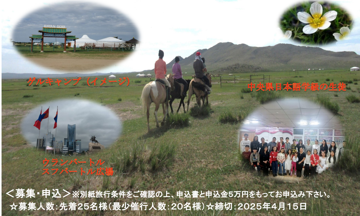
ゲルキャンプ (イメージ)

※基本相部屋です。(旅行代金に含まれるもの、含まれないものについては別紙旅行条件に記載)